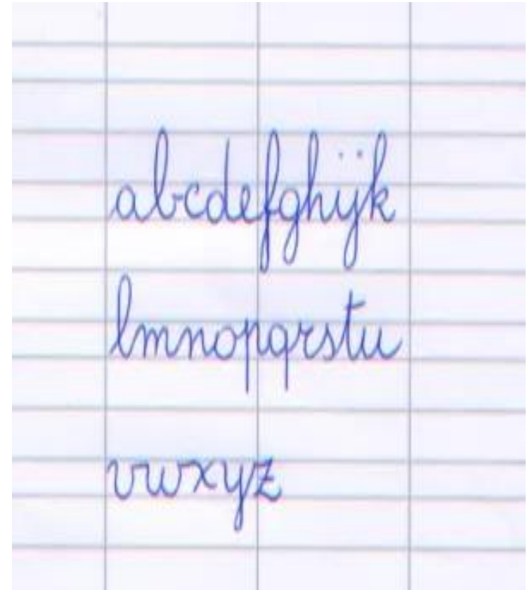
Quaderno a righe di seconda